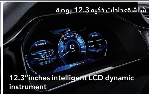
12.3" inches intelligent LCD dynamic instrument