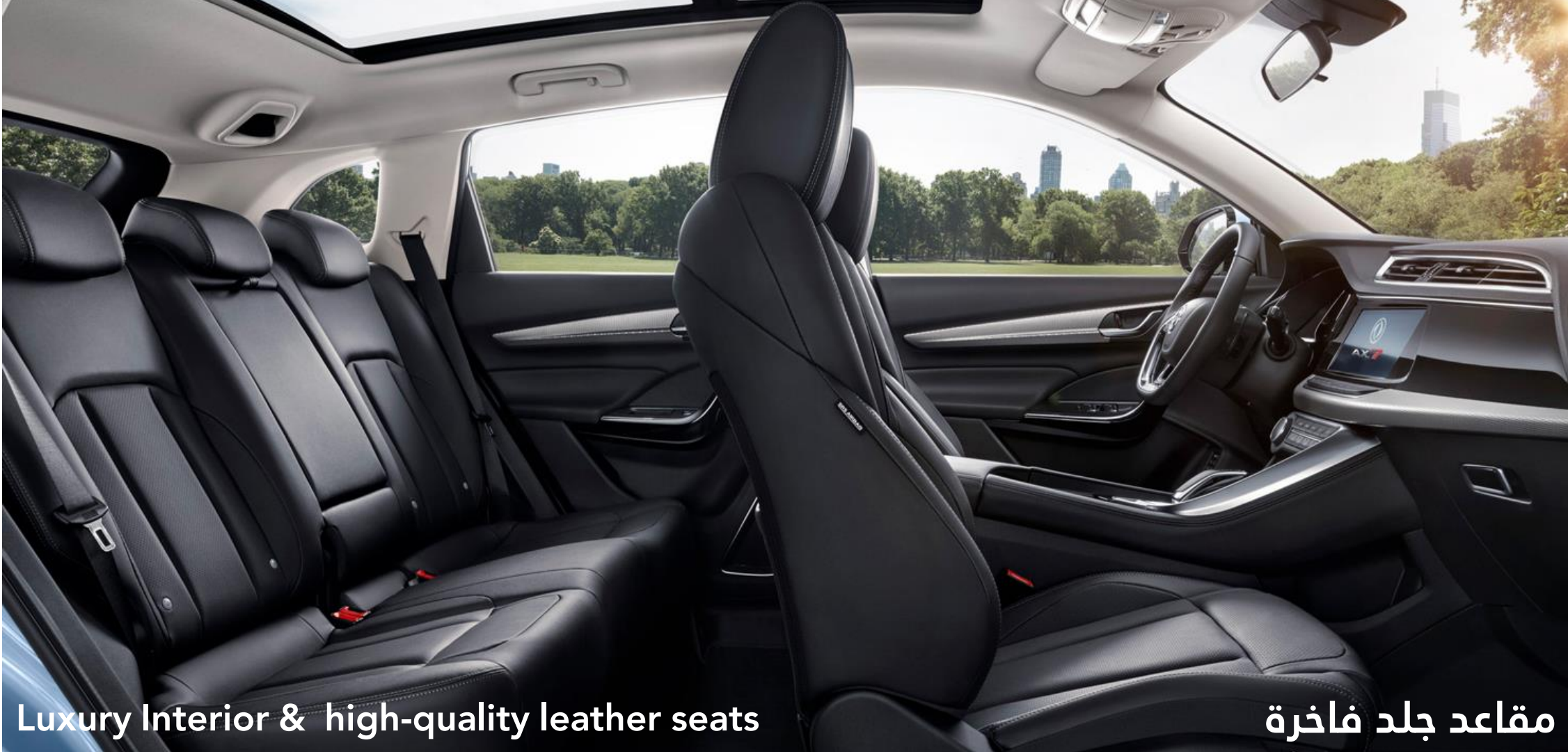
Luxury Interior & high-quality leather seats