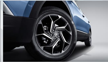
18 بوصة / لونين / جنوط المنيوم