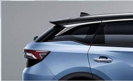
تصميم سقف انسيابي بلونين