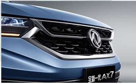
تصميم رياضي للشبك الامامي

The new-generation AX7 adopts an interactive geometric ecological aesthetic design, bringing unique and amazing enjoyment to every driver and passenger from the bottom of the eye to the bottom of the heart