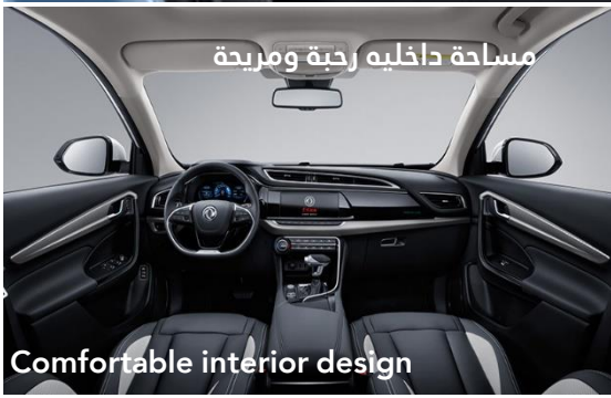
Comfortable interior design