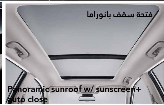
Panoramic sunroof w/ sunscreen+ auto close