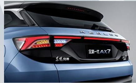
مصابيح LED خلفية