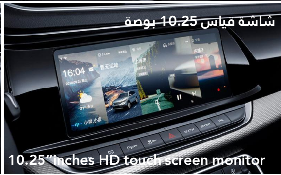
10.25" inches HD touch screen monitor