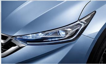
مصابيح أمامية LED مصفوفة